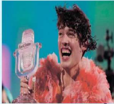
Nemo I orun

Gatnaşýan ýurtlaryň ýarym finala paýlanmagy 2024-nji ýylyň 30-njy ýanwarynda bolup geçdi. Goňşularyň ses bermek ähtimallygyny azaltmak we ýarym finalda dartgynlygy ýokarlandyrmak üçin 31 ýurt taryhy ses beriş usullaryna esaslanyp 5 kúýze bölündi. Şeýle hem, deňme-deň oýnalýan alty awto-finalistiň hersiniň haýsy ýarym finalda ses berjekdigini - kabul edýän ýurt Şwesiýa we Uly baş ýurt (Beýik Britaniýa, Germaniýa, Ispaniýa, Italiýa, Fransiýa) we kabul edýän ýurduň haýsy bäsleşik belgisi bilen bäsleşjekdigini kesgitleýär. Dabara Pernila Ferreyro Aleksandra