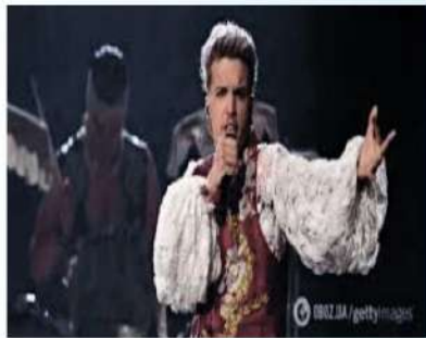
Baby Lasagna II orun

Ýaňy ýakynnda “Ýewrowideniýeniň” 68-nji tapgyry geçirildi. Bu ýyl bäsleşik “United by Music” ady bilen, Şwesiýanyň Malmýo şäherinde gurnaldy. Däp boýunça, geçen ýylky tapgyrda ýeňiji bolan döwlet özünde bäsleşigiň indiki tapgyryny geçirmäge hukuk gazanýar. 2023-nji ýylyň 7-nji iýulynda Malmýo – “Ýewrowideniýe-2024” bäsleşiginiň organizator-şäheri hökmünde ygylan edilýär.